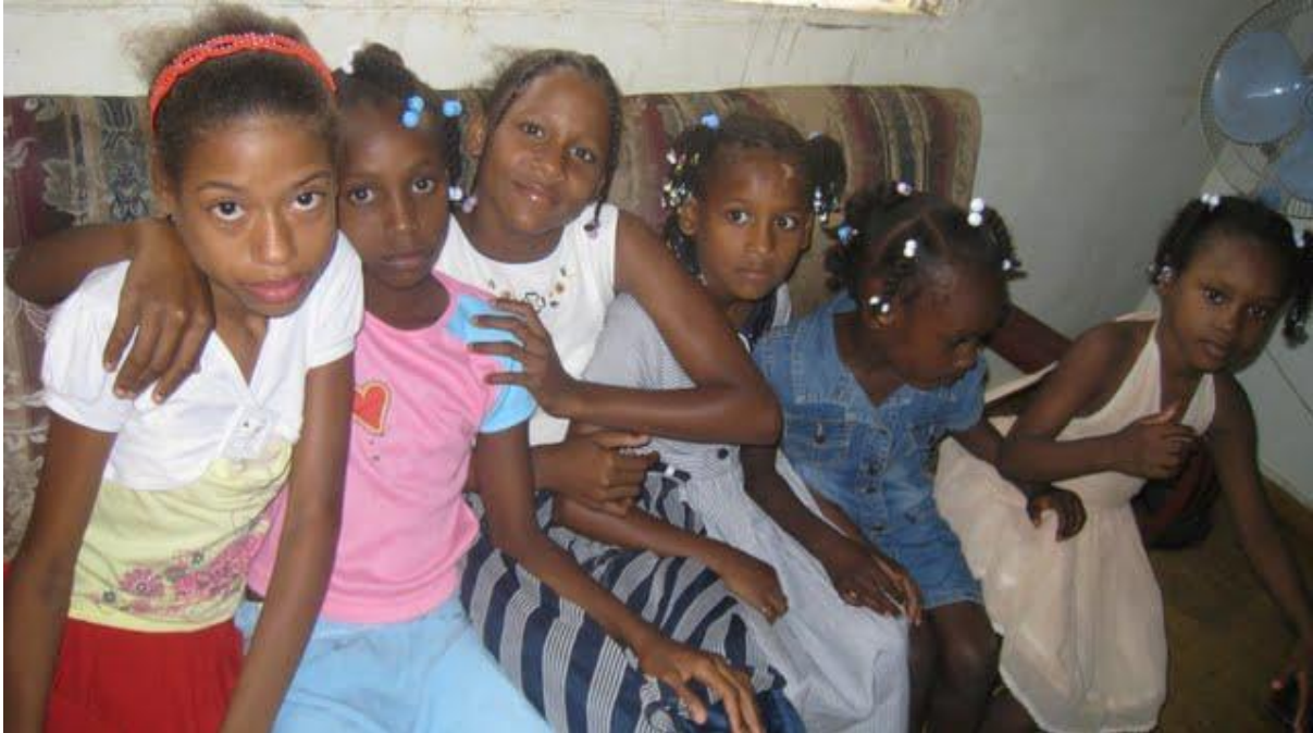
Rostros de niñas inocentes en potencial riesgo de caer en el vicio y la prostitución

Rescatar del vicio y la prostitución que potencialmente existe en dicha vecindad proveyéndoles educación cristiana, cursos vocacionales y ayuda para que realicen estudios universitarios.