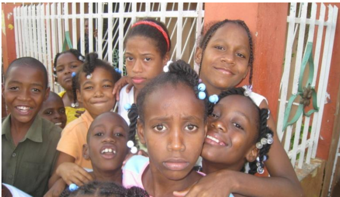
La tentación de pertenecer a una pandilla es inminente.

Niños y jóvenes con mucho talento pero sin oportunidades de recibir educación formal acorde con sus dones y habilidades